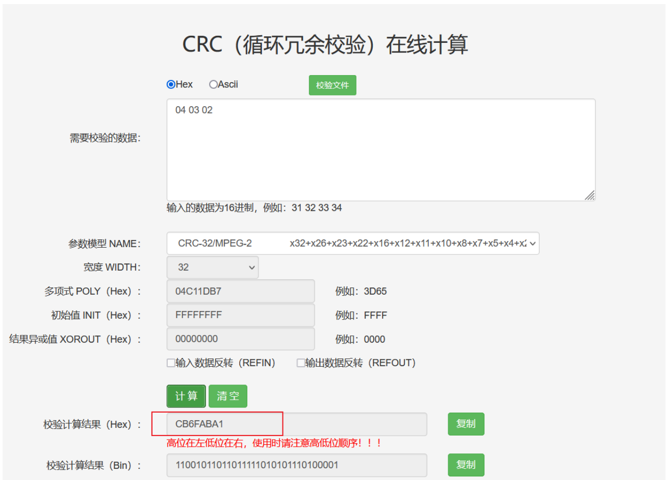
图 3.2.2 在线网页转换结果